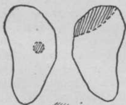
Fig. 1. // = ziek deel der longen.

Toen Rulof den 24sten voor de behandeling terugkwam, werd hem door de ouders van den patiënt medegedeeld, dat dokter F. besloten had een Röntgenfoto van de longen te maken. R. zeide toen spontaan: „dan zal ik U nu wel reeds zeggen, hoe deze opname er uit zal zien en maakte een ruwe schets van de aangedane longen (zie fig. 1).