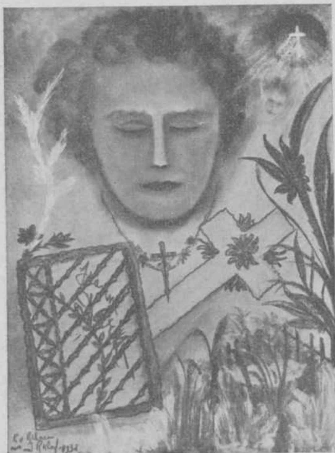
Inspiratie op het mediumschap van Jeanne d'Arc.

De eerste nog eenigszins primitieve crayon-teekeningen gingen in 3 à 4 maanden, via pastel, over in groote olieverf-schilderijen, welke de bewondering van bevoegde kunst-kenners opwekten, ook los van de verbazing over de occulte wijze waarop deze kunst-producten tot stand kwamen. In den laatsten tijd worden ook, uit een technisch oogpunt veel lastiger, aquarellen vervaardigd.